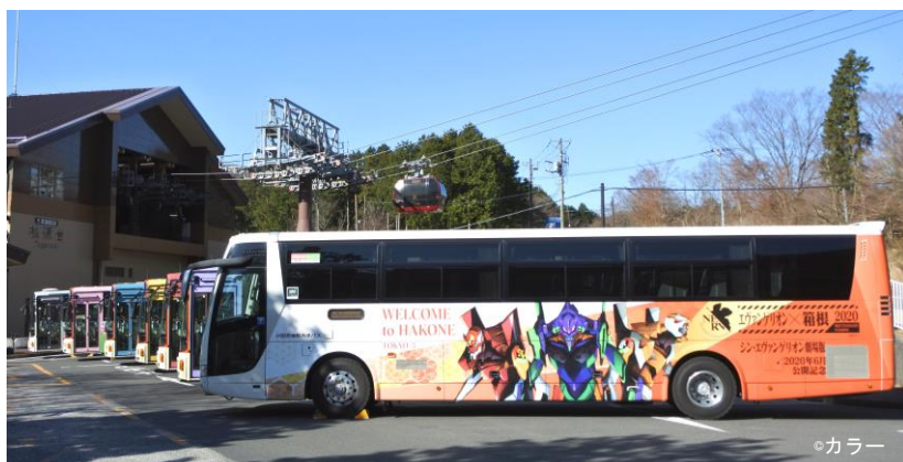
オリジナルラッピングバス

「エヴァンゲリオン×箱根 2020 MEET EVANGELION IN HAKONE」第7報！の詳細は下記のとおりです。