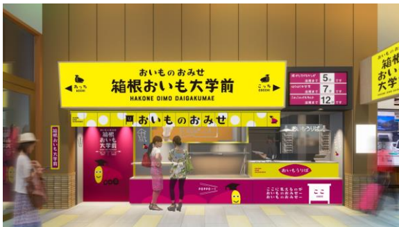
店舗外観 ※イメージ