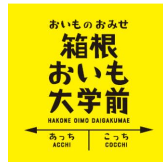
駅名看板型サイン ※イメージ