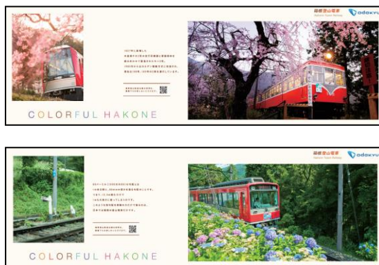
車内の中吊りポスター