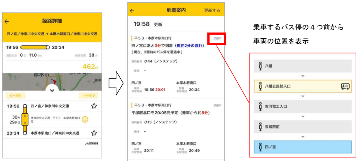
神奈川中央交通バスリアルタイム運行情報画面

また、本年6月からタイムズモビリティ株式会社が運営するタイムズカーシェアのステーション情報連携を小田急沿線から全国に拡大し、8月中旬からは新たに株式会社 NTT ドコモが運営するdカーシェアのステーション情報と複合経路検索結果の連携開始を予定しています。