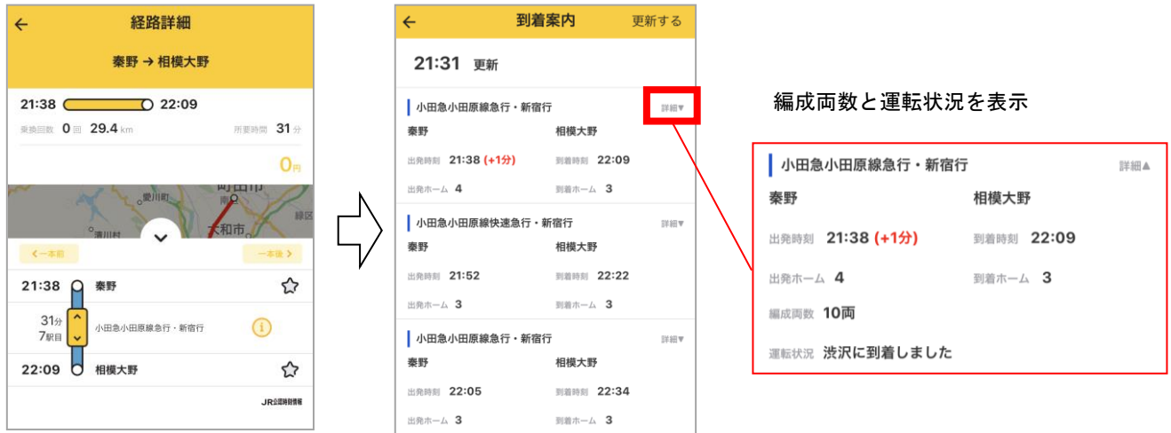
小田急線リアルタイム運行情報画面

本年4月から小田急線と神奈川中央交通の路線バスを対象に、リアルタイム運行情報の提供を開始しています。小田急線は電車の発着予定時刻や最新の運転状況を、神奈川中央交通は発着予定時刻やバス停通過情報などを、発着ホームや乗り場といった基本情報とあわせて経路検索結果に表示しています。