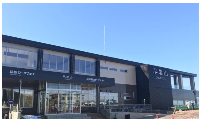
リニューアルした早雲山駅舎

今後も、訪れていただくすべての方へのかけがえのない思い出を作っていただける「世界に誇る観光地 箱根」を目指してまいります。