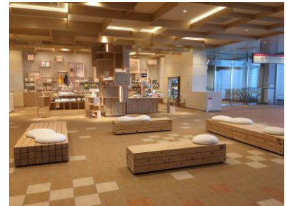
ラウンジエリアとベンチ