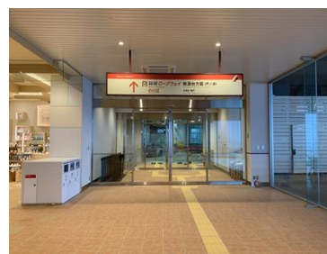
地上2階 ロープウェイのりば