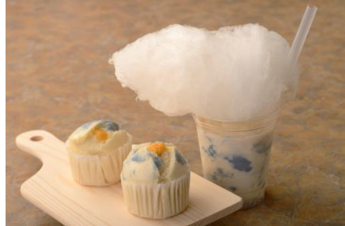
(左) くもぱん (右) ニューベル