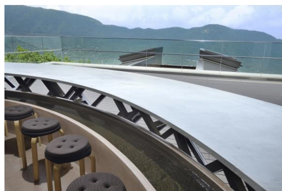
足湯から望む景色