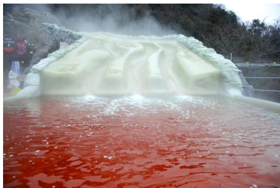
L. C. Lの湯