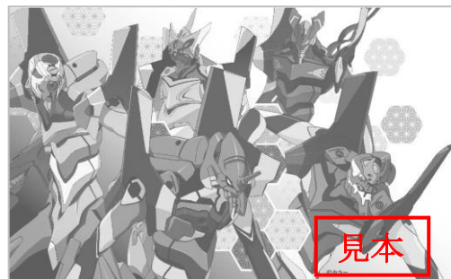
乗車券表面デザイン（イメージ）