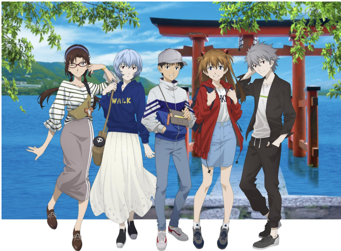
2期キービジュアル