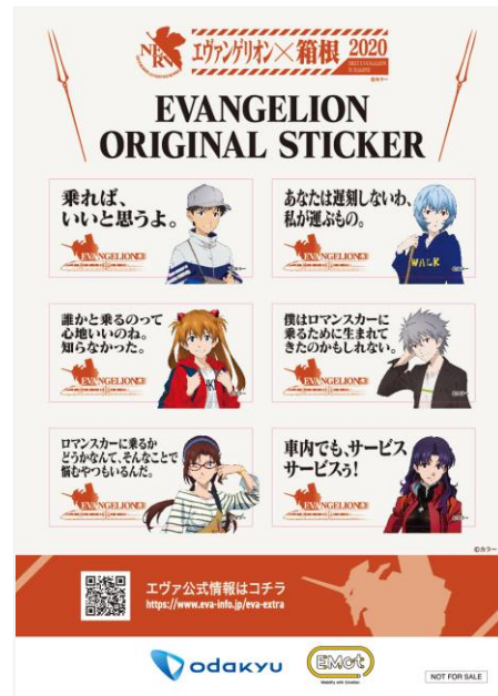
オリジナル名言ステッカー（イメージ）