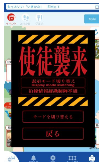
エヴァ仕様切り替え画面（イメージ）