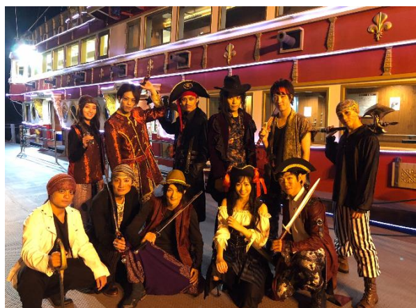
「箱根芦ノ湖 Pirates of Sunset Cruise」