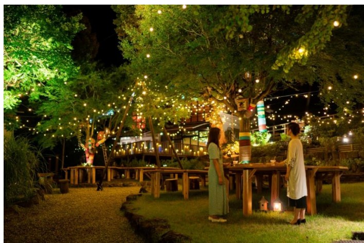
「箱根湯本 Summer Night Village」