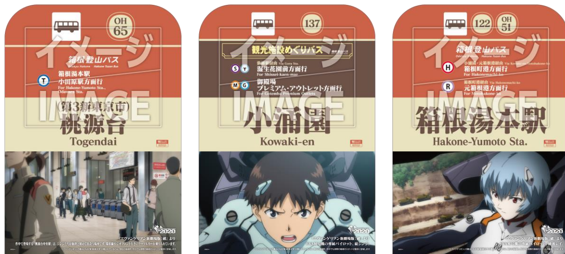
エヴァンゲリオンデザインのバス停（イメージ）

金時神社入口、仙石原小学校前、仙石、仙郷楼前、仙石高原、南仙石原、箱根カントリー入口、パレスホテル前、箱根レイクホテル前、桃源台、箱根湯本駅、小涌谷駅、小涌園、ユネッサン前、強羅駅、猿の茶屋、箱根町港、元箱根港