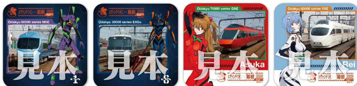
オリジナルデザインコースター（一例）