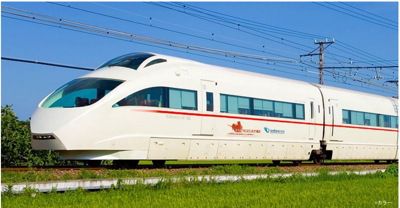
「Romancecar VSE feat. EVA」外観（イメージ）

なお、特設サイトも2019年12月23日（月）15時に更新しますので、あわせてご覧ください。