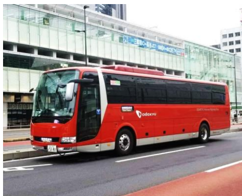
小田急箱根高速バス(GSEカラー)

小田急グループでは、御殿場における観光の魅力の向上とともに、御殿場・箱根エリアの回遊性を高めることで、一大広域観光リゾートエリアの実現を目指します。