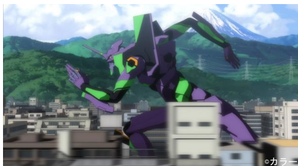
疾走するエヴァンゲリオン「初号機」