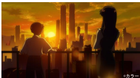
物語の舞台となる第3新東京市の夕景