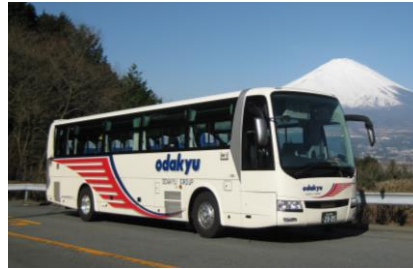
小田急箱根高速バス