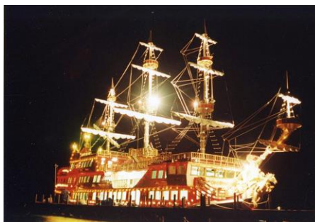
2 「箱根芦ノ湖 Pirates of Sunset Cruise」イメージ