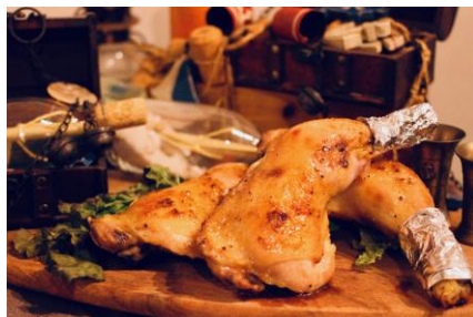
骨付き肉などのビュッフェ料理