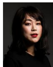
クリエイティブディレクター