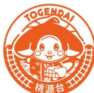
スタンプイメージ