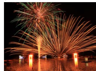
芦ノ湖夏まつりウィーク

※①～④は小田急箱根グループ主催のイベントです ⑤～⑧は小田急箱根グループ以外主催イベントです