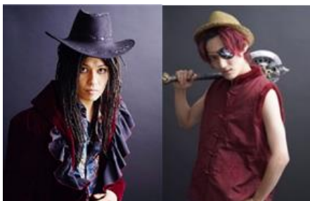
オリジナルシナリオによる海賊ショー