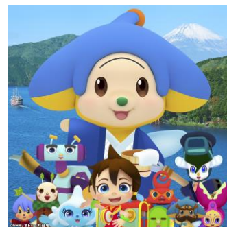
3 「オトッペとめぐる箱根オトラリー♪」