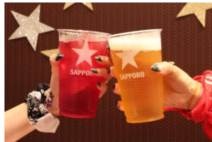
船内で提供されるドリンク