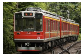
B1 (1001) レーティッシュ鉄道塗装 [1999年～]