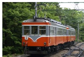
108 100形金太郎塗装 [1957年～不明] [2008年～]