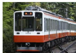
B2 (1003) 1000形登場時塗装 [1981年～89年頃] [2008年～12年][2016年～]