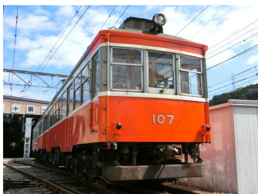
引退するモハ1形（103－107編成）