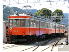
103 100形標準塗装 [1957年～]