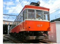
107 100形標準塗装 [1957年～]