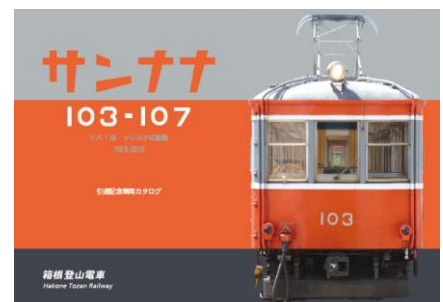
引退記念車両カタログ（イメージ）