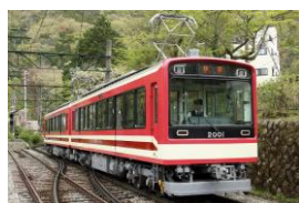
S1 (2001) 2000形登場時塗装 [1989年～99年頃] [2018年～]