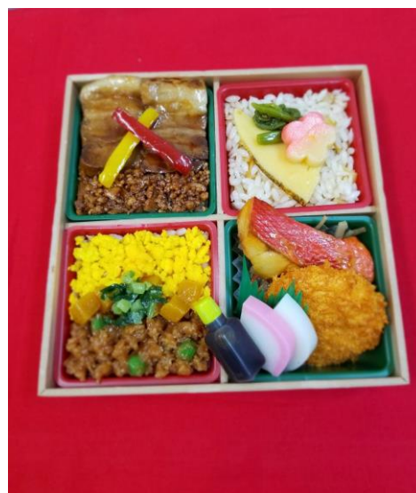
100周年記念弁当(イメージ)