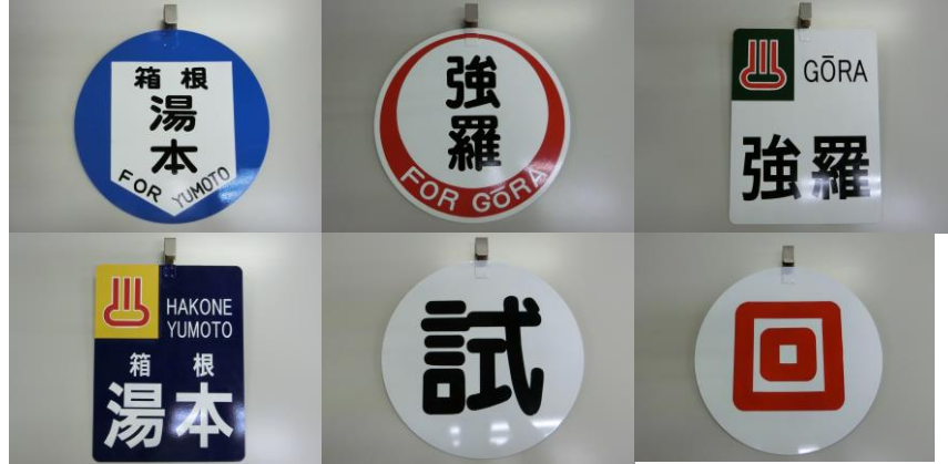
復刻方向板（イメージ）