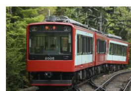
S3 (2005) 氷河特急塗装 [2009年～]

※印の車両は、本年度塗装変更を実施する車両。109号車については、4月17日よりこの塗装で運行中。106号車については、6月11日より写真のカラーで運行を予定しております。