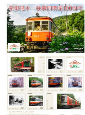
100周年記念切手(イメージ)