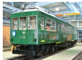
※109 100形緑塗装 [1935年～49年頃] [2019年4月～]