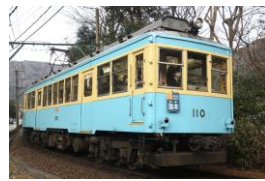
※106 100形青塗装 [1949年～57年頃] [2019年6月～]