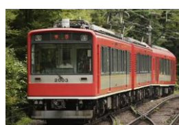
S2 (2003) アレグラ号塗装 [2014年～]