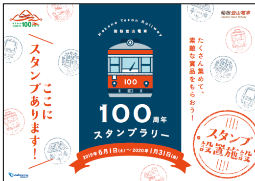
スタンプラリーポスター（イメージ）

※上記の箱根地区108箇所の他、原鉄道模型博物館（神奈川県横浜市西区）に1個でスタンプ3個分がカウントされるボーナススタンプを設置します。