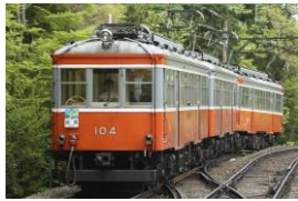
104 100形標準塗装 [1957年～]

現在も様々な特別塗装列車を運転しておりますが、当キャンペーンに合わせて箱根登山電車100年の変遷を再現した塗装列車を新たに加えて100周年キャンペーンを盛り上げます。