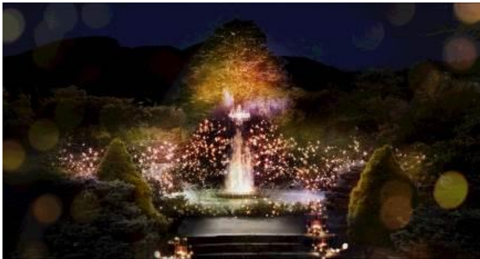
噴水池における光の装飾「まだ春が眠る泉」（イメージ）

また、期間中はハッシュタグキャンペーンの実施や園内の一色堂茶廊では限定のメニューを発売します。加えて、土休日には、本イベントへのお出かけに便利な箱根登山ケーブルカーの延長運転を行うなど、夜の箱根観光がますます楽しくなるイベントとして開催します。