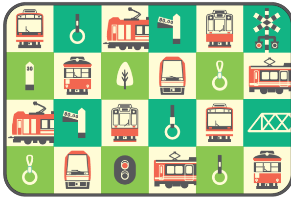
オリジナルひざかけイメージ