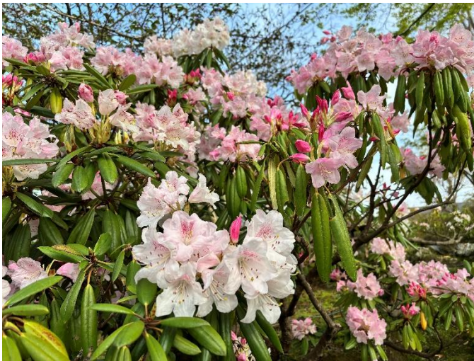
アカボシシャクナゲ（4月14日撮影）