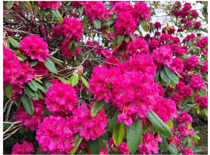
西洋シャクナゲ（4月14日撮影）