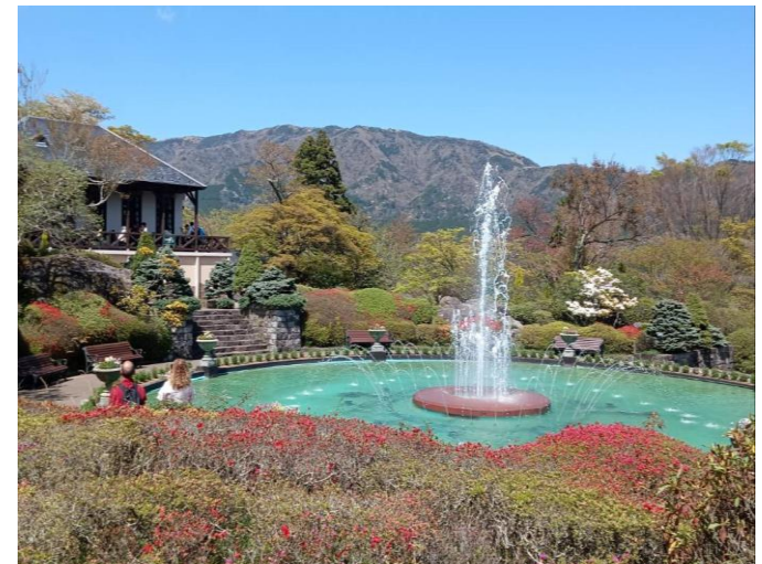
噴水池周辺のツツジの様子（4月16日撮影）