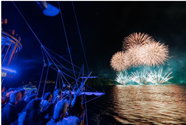
箱根海賊船 花火クルーズ（イメージ）