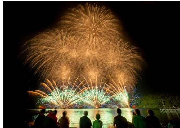
芦ノ湖花火（イメージ）