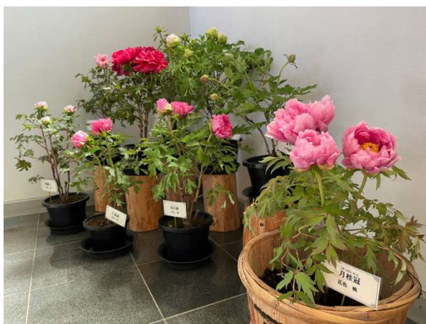
展示の様子（イメージ）

当イベントでは、公園のシンボル「湖畔展望館」内に、見応えある美しい「冬咲き牡丹」約30鉢を展示して、冬の恩賜箱根公園を華やかに彩ります。