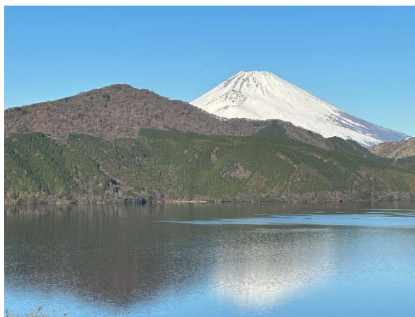
湖畔展望館バルコニーから眺める 冬の富士山