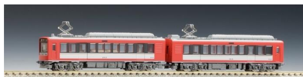
サン・モリッツ号

※上記画像は以前発売された際のものであり、今回発売される商品とは一部仕様が異なります。