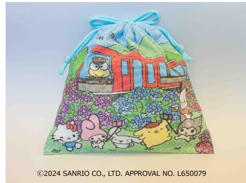
記念コラボきんちゃく