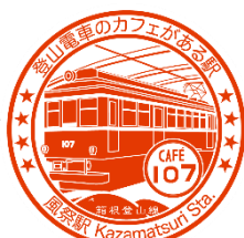
スタンプデザイン（風祭駅）

(5) その他：6駅以上のスタンプを取得し、さらにSNS投稿いただいた方はCAFÉ107にてソフトドリンク1杯が無料になるキャンペーンも実施します。