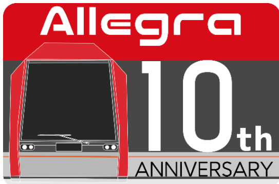
乗務員デザイン ヘッドマーク