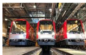
商品画像イメージ