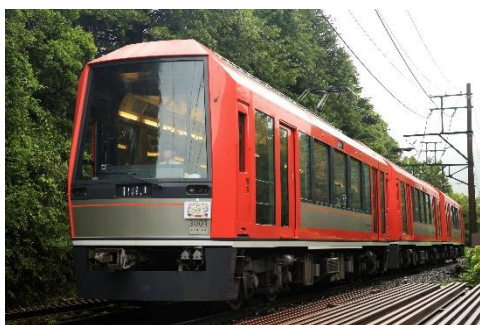
2014年11月1日就役 3000形「アレグラ号」