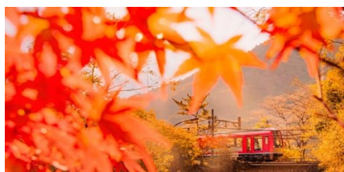
掲出作品の一つ「最高の秋」