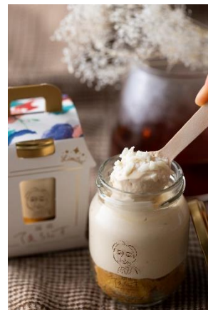
ティラミス ミルクティー