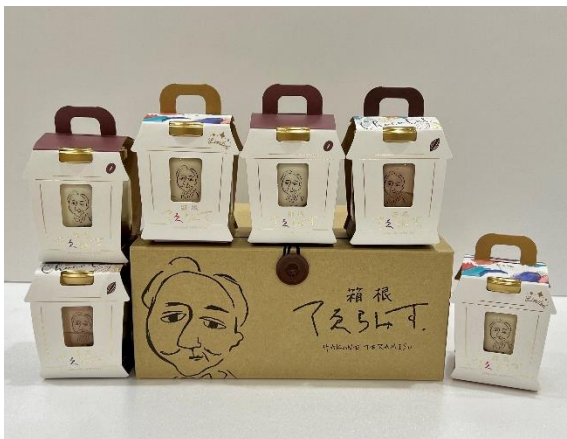
通販商品イメージ