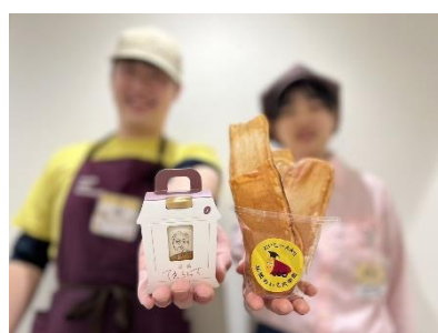
コラボキャンペーンイメージ