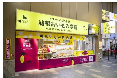
箱根おいも大学前