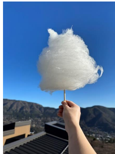
雲をイメージした綿あめ