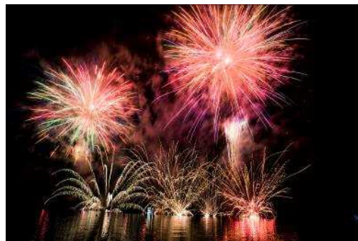
花火（イメージ）