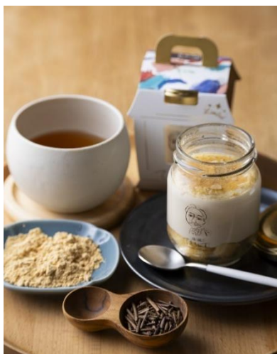
新商品「ほうじ茶きなこ」