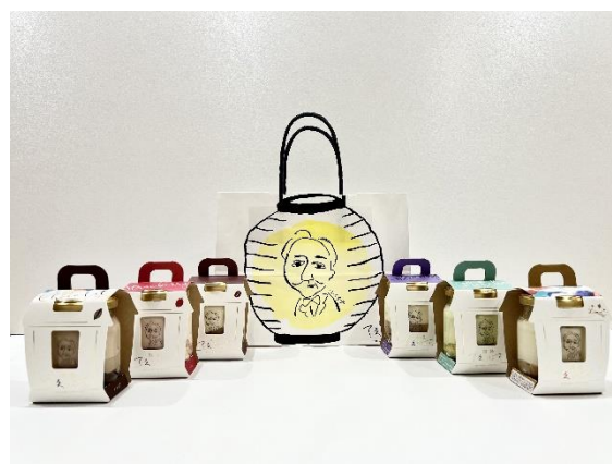
「箱根てゑらみす福袋」