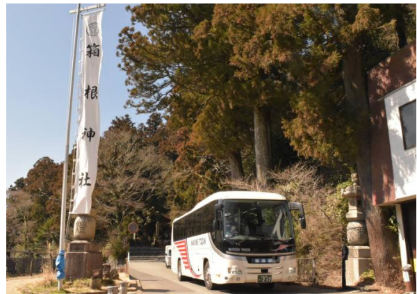
箱根神社付近を運行する芦ノ湖ライナー