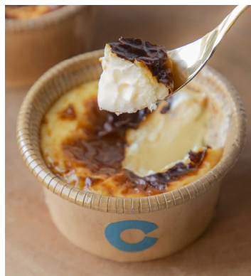
限定特典「チーズケーキ」（イメージ）