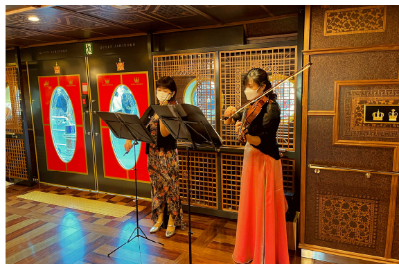
船内の生演奏（イメージ）