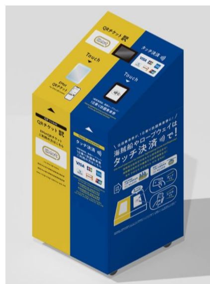
専用端末（イメージ）

小田急箱根グループでは、タッチ決済とQR チケットで周遊観光の環境整備を推進してまいります。なお、ロープウェイに国際ブランドのタッチ決済を導入するのは、全国初の取り組みです。