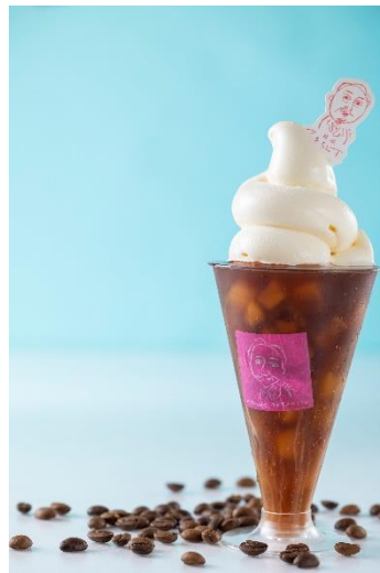
「コーヒーフロート」