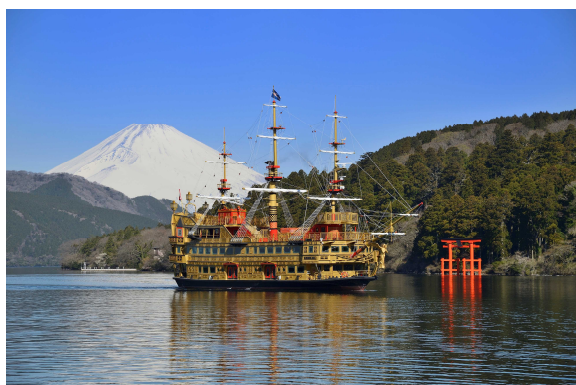
箱根海賊船（イメージ）