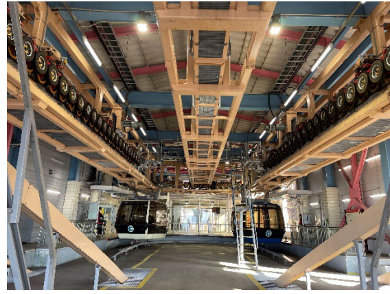
大涌谷駅ホーム内部の様子（イメージ）