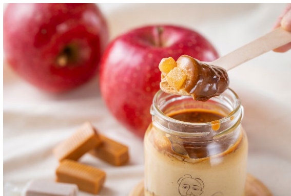
「キャラメルりんご」