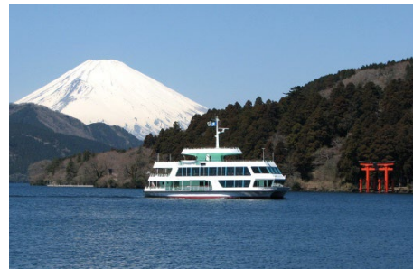
芦ノ湖遊覧船（イメージ）