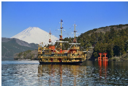
箱根海賊船（イメージ）