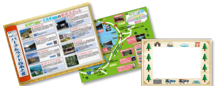
パンフレット「指南之書」とスタンプ台紙のポストカード (イメージ)