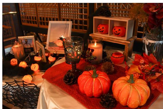
ウェルカムテーブル（イメージ）