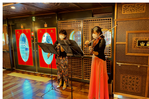
船内の生演奏（イメージ）