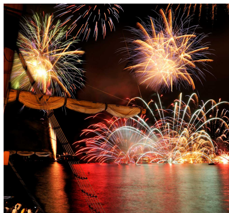
観覧船からの花火（イメージ）