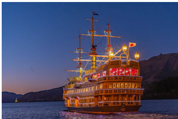
箱根海賊船 花火観覧船（イメージ）