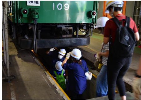
車両床下の見学（イメージ）