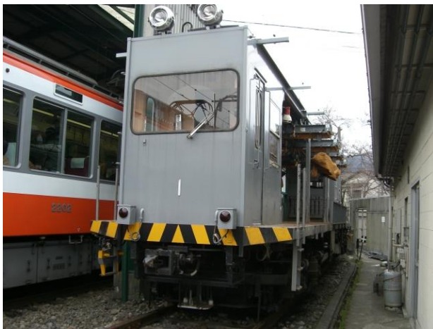
1975年～2009年（グレー色塗装）のモニ1形

モニ1形を車両基地に展示しお客さまにご覧いただくイベントは今回の「貨物電車モニ1形・車両基地見学会」が初めての開催であり、また多くの方にとって初めてモニ1形の車体や走行の様子を間近に見る事のできる機会となっております。