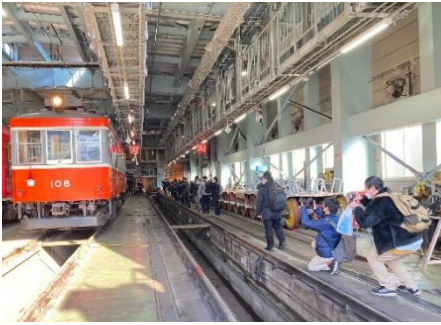
車両見学会（イメージ）