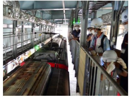
車両屋根上の見学（イメージ）