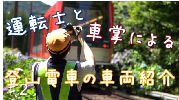
「#2 “Team 乗務員”モニ1形 ～車両紹介～」