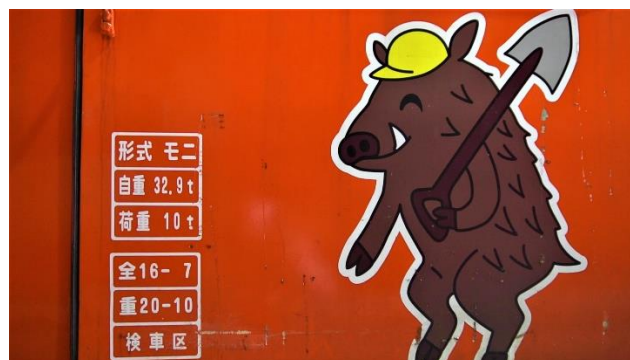
モニ1形に描かれたイノシシのモーニーくん