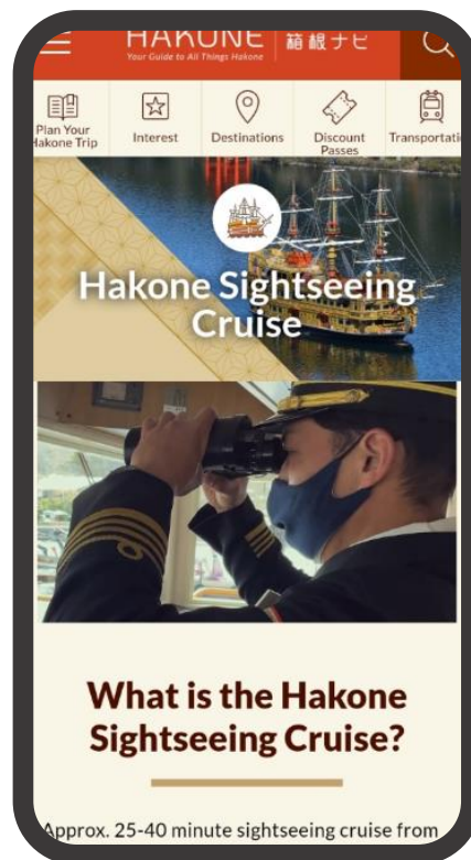
今回のリニューアルで一元化される 乗り物案内ページ（一例）