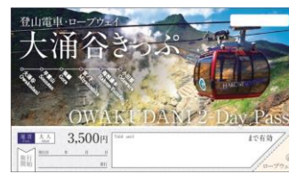
使用する周遊きっぷの例