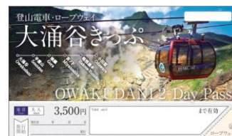
使用する周遊きっぷの例