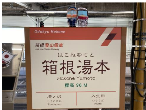
箱根湯本駅駅名標

3月26日(土)・3月27日(日)の2日間、箱根湯本駅にて「駅名おなまえキーホルダー」を200個限定で発売いたします。箱根登山電車の駅名標をモチーフにしたデザインで、駅名の部分にはお名前やメッセージ等、好きな文字を入れることができます。世界に1つだけのオリジナルキーホルダーを作成してみませんか？