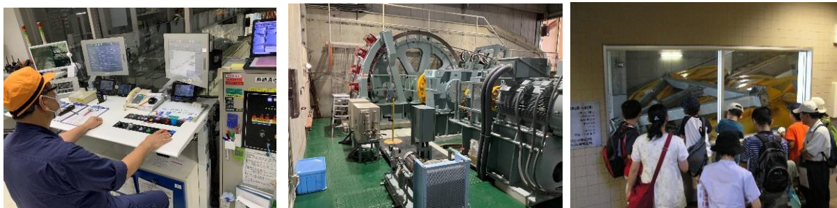
過去に開催したバックヤードツアーの様子

3月13日(日)10:00AMより、箱根登山電車 ONLINESTORE ( https://htr-merch.stores.jp/ )にて電子予約チケットの発券を開始いたします。参加料金は、当日ツアー開始前に現金のみでお支払いとなります。詳細は箱根登山電車 ONLINESTORE「早雲山駅バックヤードツアー参加予約をされるお客さまへ」をご覧ください。なお、当日枠はございません。