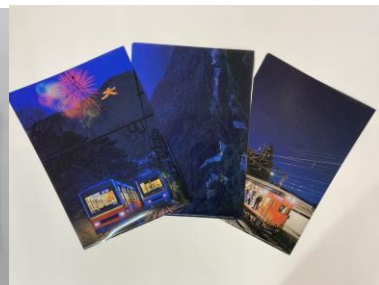
ケーブルカー100周年記念オリジナルグッズBセット