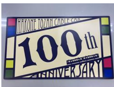
100周年記念ヘッドマーク (横 595×縦 350mm)

ケーブルカー開業100周年記念ヘッドマーク ステッカータイプ（2名さま）、ケーブルカー100周年記念オリジナルグッズAセット【ペンケース、クリアファイル1枚】・Bセット【クリアファイル3枚、文具】（各3名さま）、登山電車レールセット（3名さま）、お子さま用箱根フリーパス1枚（3名さま）、2021年度用列車運行図表（6名さま）