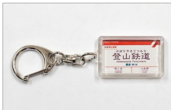
駅名おなまえキーホルダー デザイン