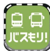
「バスもり！」アイコン(イメージ)