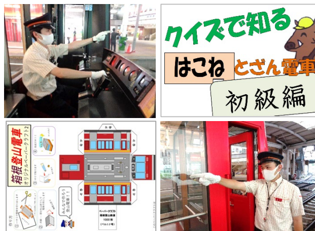
イベント特設ページ イメージ画像