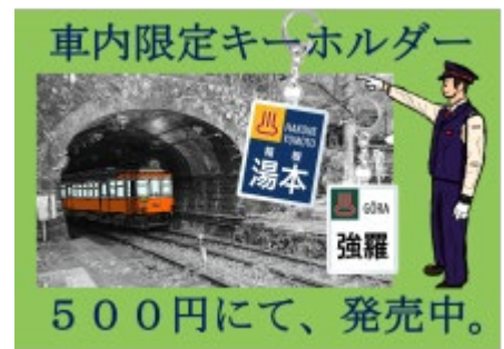
▲車内告知ポスター