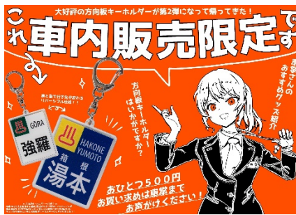
▲車内告知ポスター