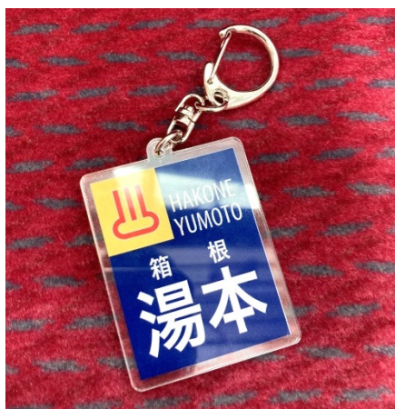
方向板キーホルダー