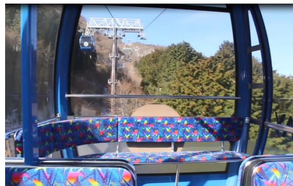
ゴンドラ貸切乗車(イメージ)